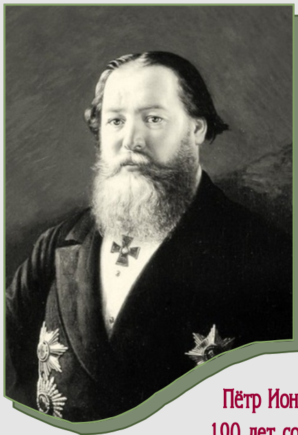
Пётр Ионович Губонин 190 лет со дня рождения